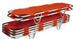
brancard catastrophe snogg