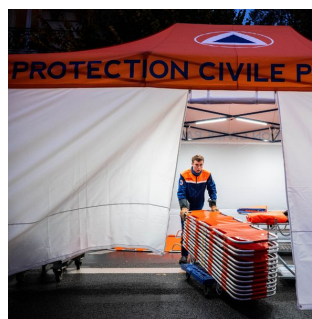
brancard catastrophe snogg