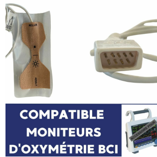
Capteur pour oxymètre BCI SPECTRO2 à usage unique