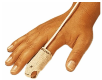
Capteur pour oxymètre BCI SPECTRO2 à usage unique