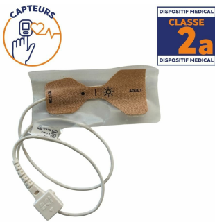
Capteur pour oxymètre BCI SPECTRO2 à usage unique