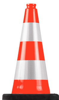
751150 Cone de signalisation chantier