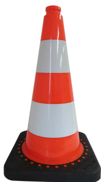
751140 Cone de signalisation chantier