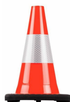
751171 Cone de signalisation chantier