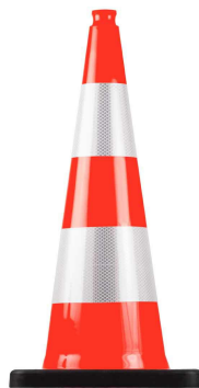
751170 Cone de signalisation chantier