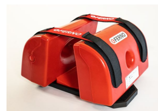
Immobilisateur de tete B Lock pour civière Scoop EXL