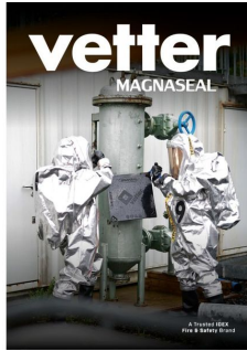
Cas d'usage Magnaseal