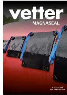
Exemples multi tailles du pack Magnaseal