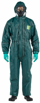
Combinaison de protection chimique cat 3 type 3 4 5 AlphaTec 4000