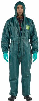
Combinaison de protection chimique cat 3 type 3 4 5 AlphaTec 4000