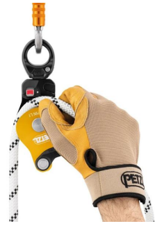
poulie spin l1