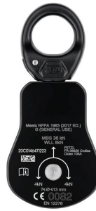
poulie spin l1