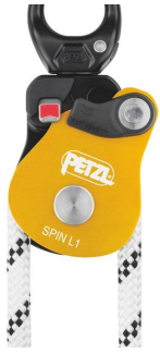
poulie spin l1