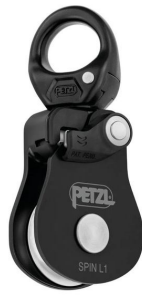
poulie spin l1