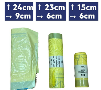
déchets d'activité de soins à risque infectieux