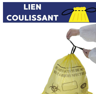
déchets à risque infectieux sac dasri