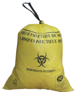
Sac dasri jaune poubelle pour déchets infectieux Contenance 15L 30L 50L