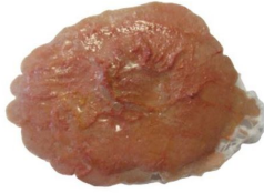
Plaie filet par brûlure thermique simple