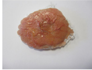
Plaie filet par brûlure thermique simple