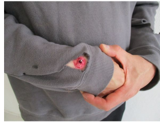
Plaie filet avec clou