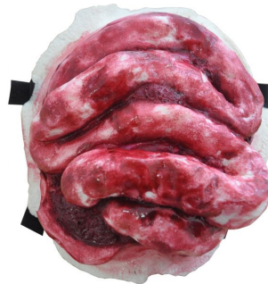
Plaie filet avec éviscération